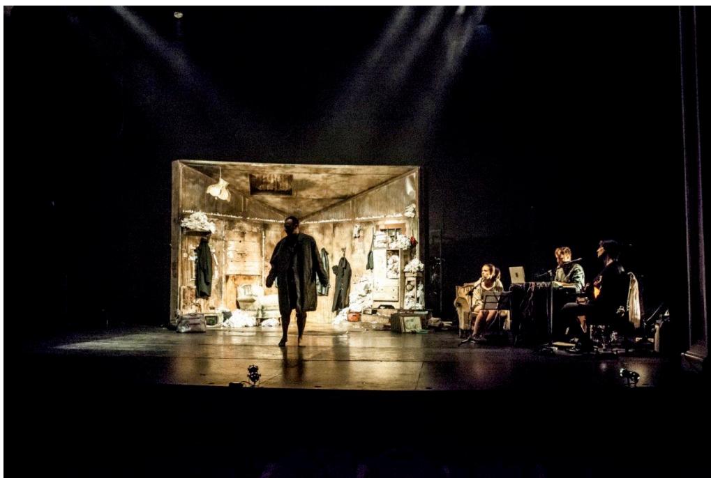
Ilustración 2- Fotografía: Jacobo Medrano

En la actualidad la compañía mantiene un repertorio vivo con 5 producciones en gira “TERESA (Ora al alma)”, “En el desierto”, “Cenizas o Dame una razón para no desintegrarme”, que es finalista para dos Premios Max en 2015 (Mejor Bailarín y Mejor Espectáculo de Danza) y “El Cínico” que ya prepara su gira para 2016.