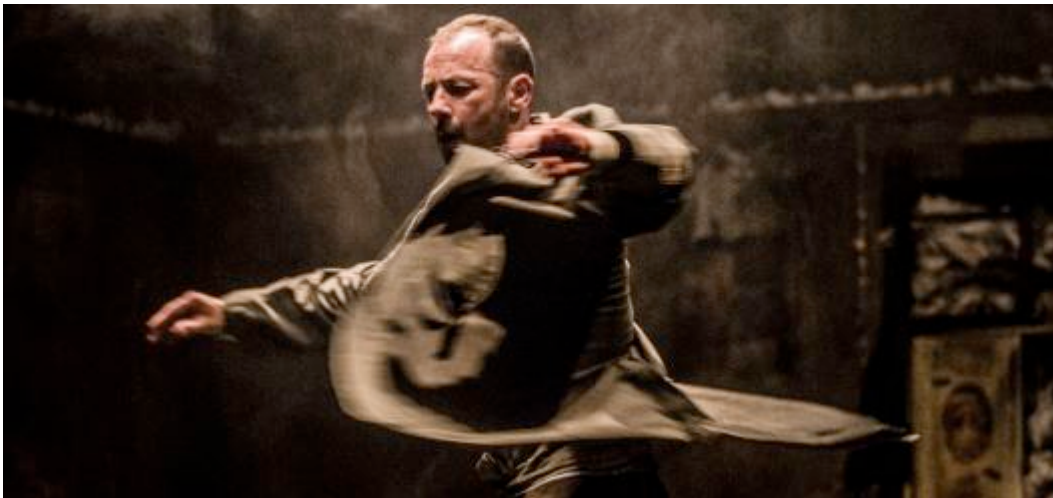
Ilustración 1- Fotografía: Jacobo Medrano

David Picazo, de nuevo a la dirección escénica de una pieza de Losdedae, completa este trío que se propone el reto de crear y recrear un personaje único, que habite en un paisaje mínimo pero cargado de significados, acompañado de música en directo y que compartirá con el público durante los 60 minutos de duración de la obra.